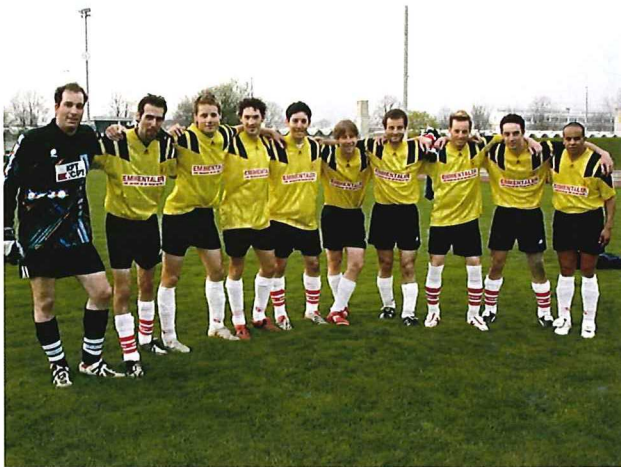
FC EDA C-Liga