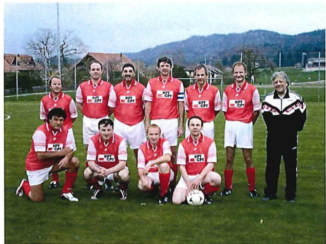
FC EDA Veteranen